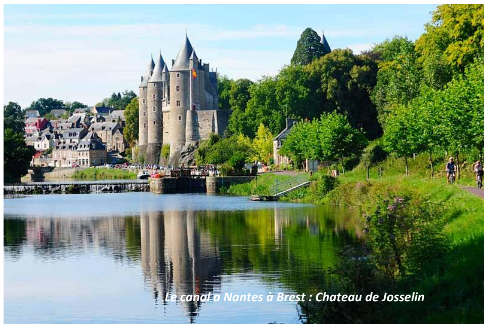
Le canal a Nantes à Brest : Chateau de Josselin

Francés. El bretón aún se habla gracias al desarrollo de las escuelas DIWAN que enseñan ese idioma en las escuelas.