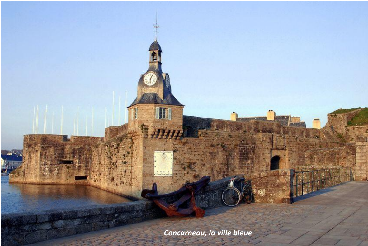
Concarneau, la ville bleue