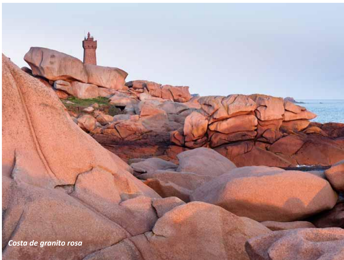
Costa de granito rosa

Alojamiento y cena en el Resort Thalasso Concarneau****