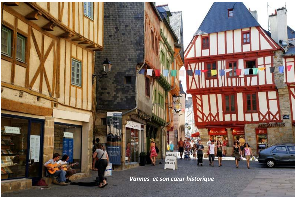
Vannes et son cœur historique