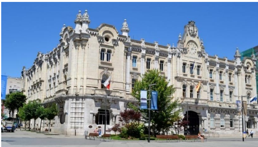
Ayuntamiento de Santander

Salida del grupo de acompañantes para una visita guiada por los lugares turísticos de la zona.