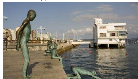
Los raqueros, Puerto de Santander