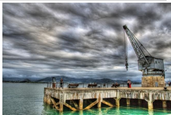
La Grua de Piedra

Regreso desde Santander a las 17:30 horas