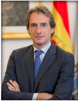
Iñigo de la Serna Hernáiz, Alcalde de Santander y Presidente de la Federación Española de Municipios y Provincias (FEMP)