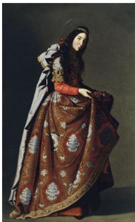
Zurbarán Santa Casilda, c. 1630-1635 Thyssen-Bornemisza

La exposición ofrecerá a los visitantes del Museo en el verano de 2015 un selecto recorrido por la producción del artista extremeño desde sus primeros encargos hasta las obras claves de su periodo de madurez; una nueva visión de uno de los pintores más importantes del Siglo de Oro español gracias a la presencia de lienzos inéditos o recuperados en los últimos años y que no han sido nunca expuestos en España.